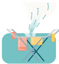
De was drogen in huis