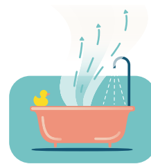
Douchen of baden