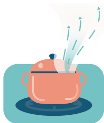
Koken zonder goede dampkap