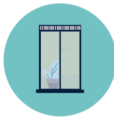
Open je ventilatieroosters