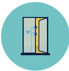
Zet je raam open

Zorg voor een luchtstroom in je huis door verse lucht binnen te laten en vervuilde of vochtige lucht af te voeren.